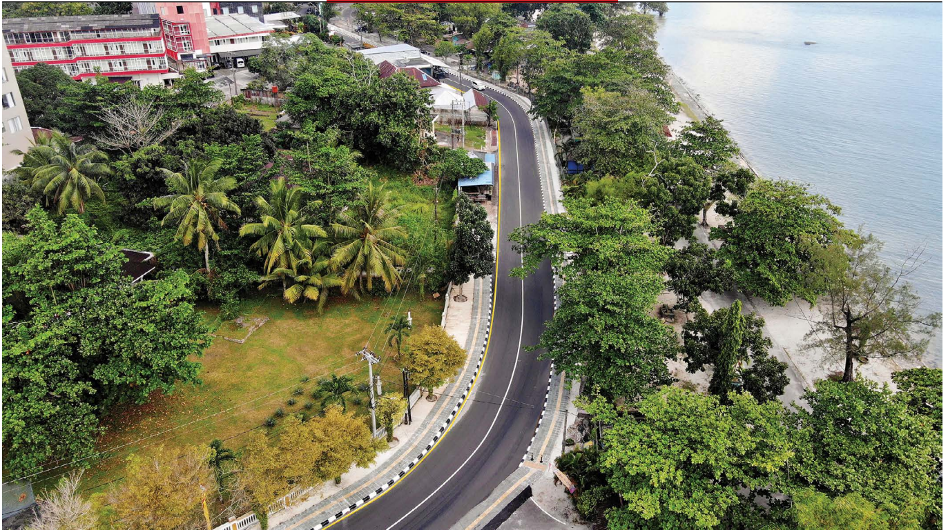
Trotoar di kawasan wisata Pantai Tanjung Pendam bersolek menyambut perhelatan G20 di Belitung.